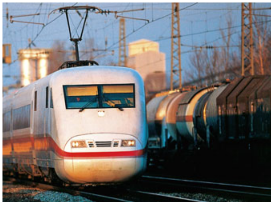
Schnellzug ICE: „Hochgeschwindigkeitsbesoffen“

Tiefensees „Masterplan“ geht davon aus, dass der Güterverkehr bis 2025 um 70 Prozent zunehmen wird, doch das neue Milliardengleis wird kaum für Entlastung sorgen. Mit zwei Prozent steigen die Schienen so stark an, dass sie von schweren Güterzügen kaum benutzt werden können.